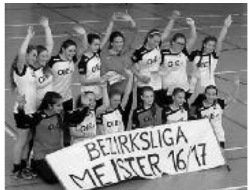
Unsere C-Jugend wurde ungeschlagen Meister

Die folgenden Aufgaben in Wittlich (37:22), in Neuerburg (25:17) und gegen Prüm (27:16) wurden ebenfalls souverän erledigt. Somit ist unsere weibliche C-Jugend ungeschlagener Bezirksmeister.