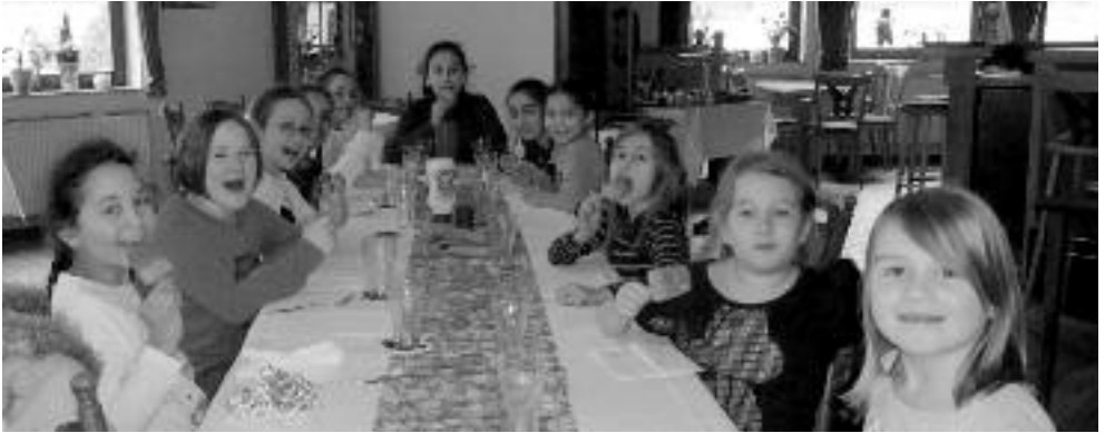
Unsere Flower-Power-Girls bei Ihrer Belohnung für das anstrengende Sondertraining