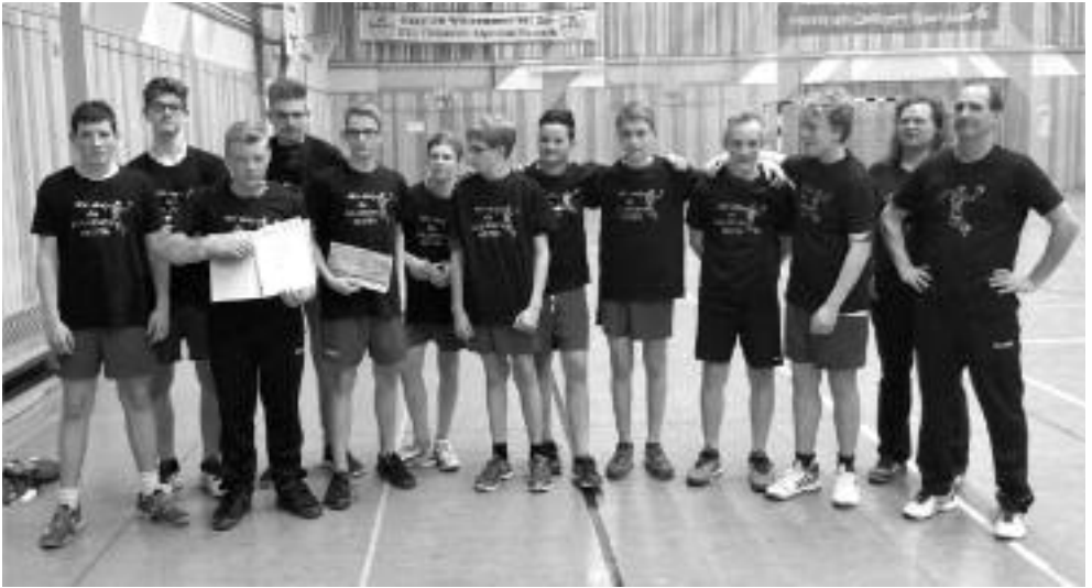
Auch unsere männliche C-Jugend wurde Bezirksmeister

statt. Die weibliche C-Jugend muss am 30.04. in Hamm/Altenkirchen antreten. Für das Endturnier der männlichen C-Jugend sind wir als JSG Obere Nahe der Ausrichter. Nähere Infos erhalten Sie in der Tagespresse.