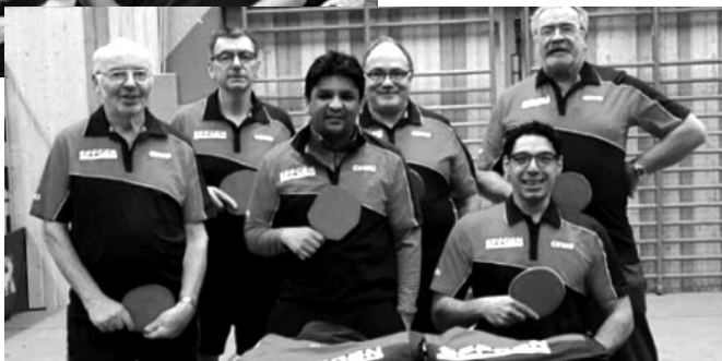
1. und 2. Herrenmannschaft mit den neuen Trikots