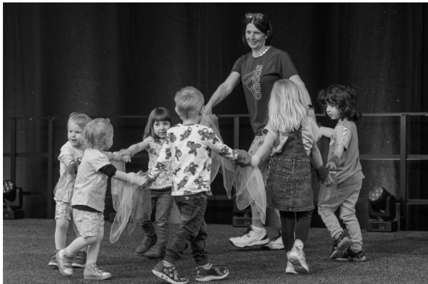
Mini-Dancer-Gruppe auf der Gesundheitsmesse