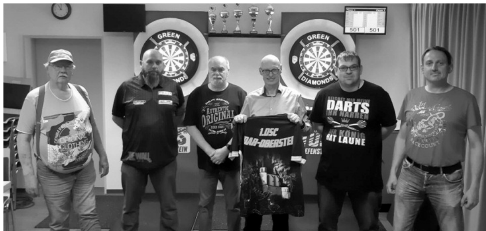
Die Mitglieder des 1. DSC Idar-Oberstein

Interessierte sind herzlich zum Probewerfen eingeladen - von ca. 8 Jahren