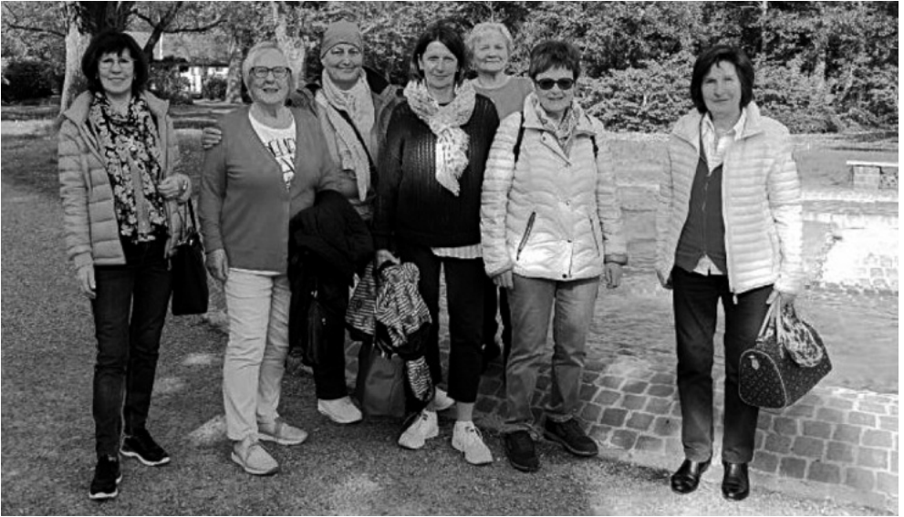
Die Seniorensportgruppe bei ihrem Ausflug

Wir sind auch sehr unternehmungslustig, unsere kleine Tagesfahrt in die Pfalz zum Spargelessen. Erste Station in Dudenhofen, Führung auf dem Spargelfeld – sehr interessant und viel Arbeit. Anschließend haben wir die die Sortierhalle besichtigt, eine aufwendige Arbeit, wenn man sich das mal angeschaut hat, bezahlt man gerne etwas mehr für den Pfälzer Spargel. Zum Mittagessen in Dudenhofen – wir genossen das reichhaltige Spargelbuffet mit Spargelcremesuppe, Stangenspargel, Sauce Hollandaise, neue Kartoffeln und vieles mehr. Es war alles sehr lecker und zu empfehlen. Am Nachmittag hatten wir beim schönsten Wetter Aufenthalt in der Stadt Speyer. Es war wie immer ein toller Tag, wenn Engel reisen, scheint die Frühlingssonne. Die nächste Tour ist schon geplant. Ein Dank